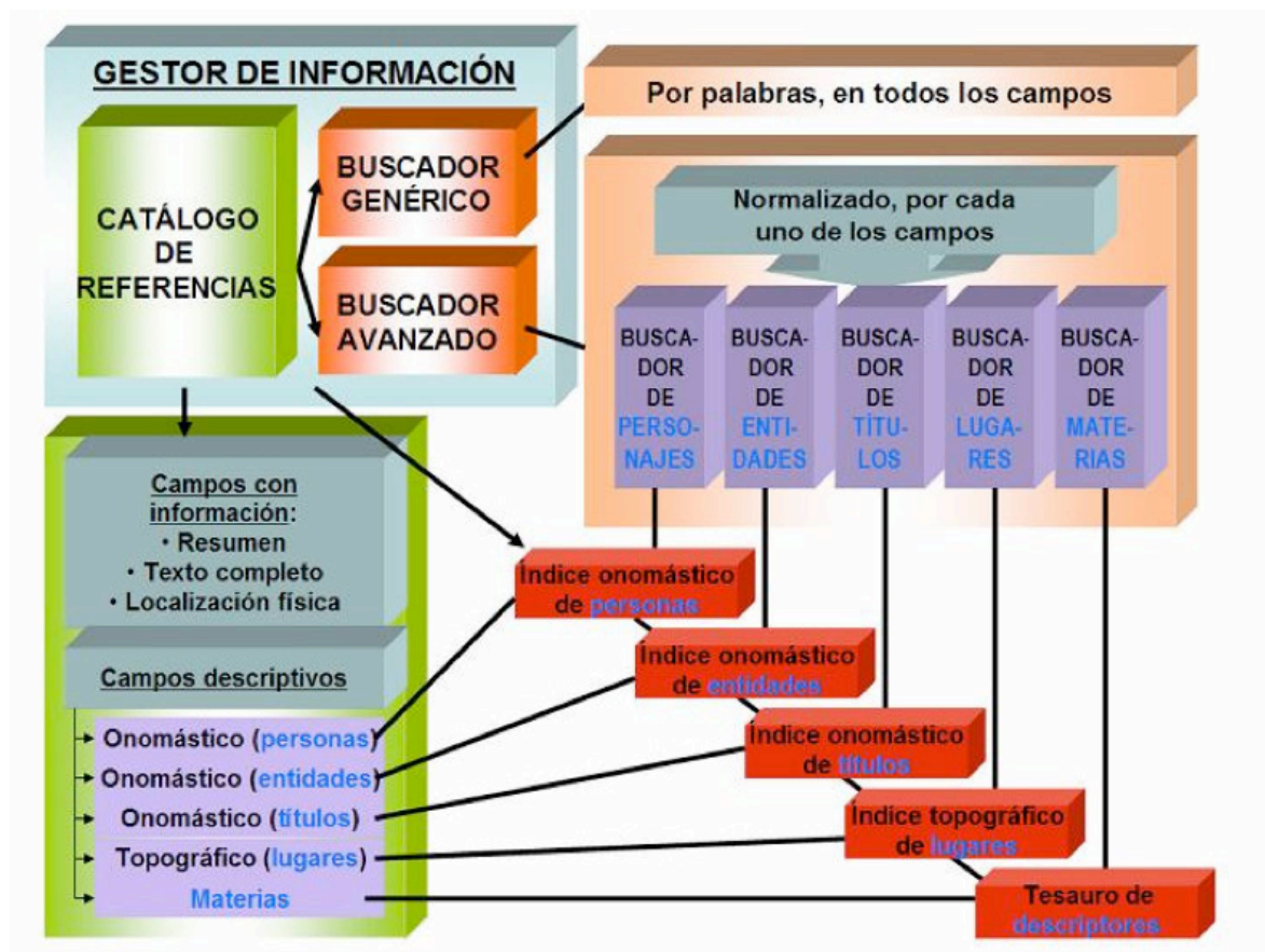
Figura 1. Esquema de componentes del gestor de información

Para la confección del mencionado Sistema de Información, extrajimos —tras su lectura y estudio sistemático— una cantidad aproximada de 750 fragmentos o referencias específicas sobre diversos aspectos de la Cultura Escrita dentro de la obra, elaborando un conjunto de herramientas como las que acabamos de describir e integrándolas dentro de un gestor automatizado y globalizado que serviría de ayuda y de base para cualquier investigador o usuario interesado en la temática.