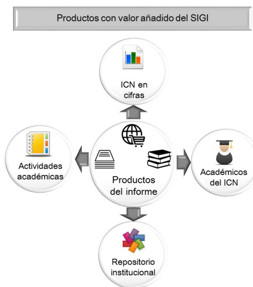
Figura 4. Productos con valor añadido

Finalmente, para promover y divulgar los productos obtenidos se han utilizado las páginas web institucionales y de la propia UIB (Figura 8).