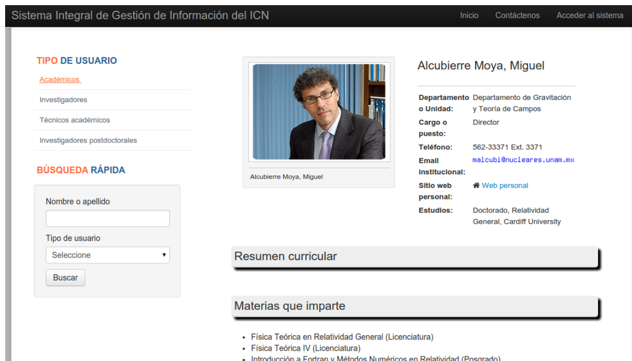
Figura 7. Página personal por académico