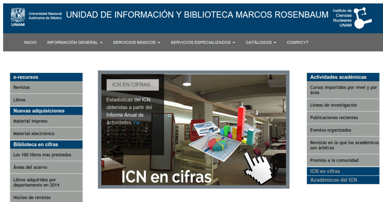
Figura 8. Página Web de la Unidad de Información y Biblioteca