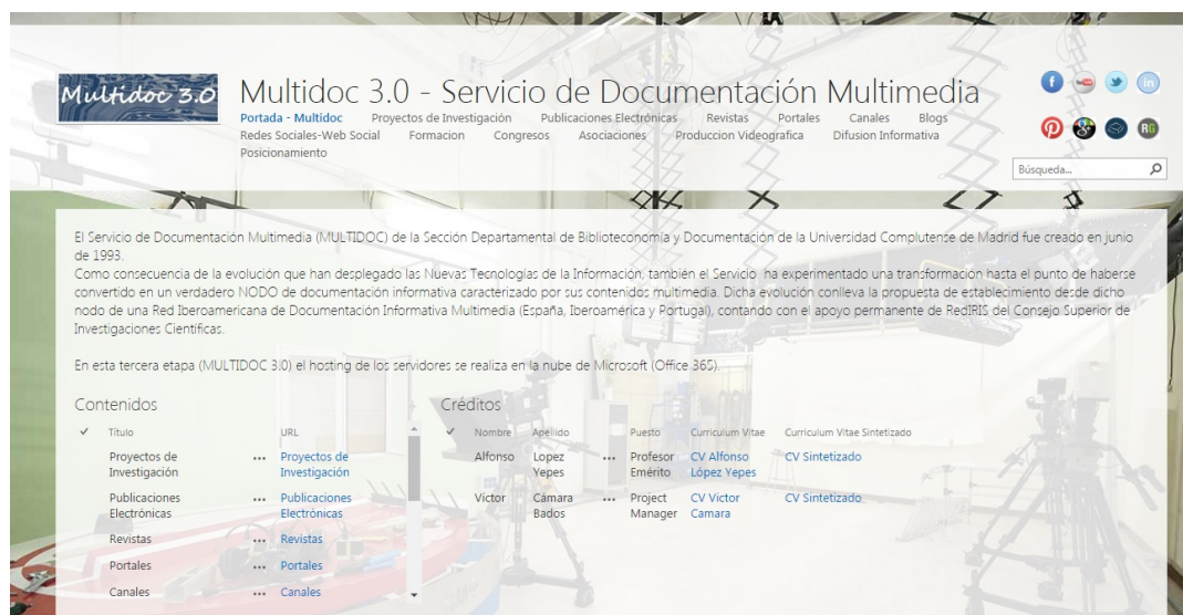
Figura 1. Servicio de Documentación Multimedia

d'Audiovisuals UB, 2015), Servei de Recursos Audiovisuals UIB (Servei Recursos Audiovisuals UIB, 2015), Complumedia o el propio Servicio de Documentación Multimedia de la UCM. O también Planeta Biblioteca canal radiofónico creado por Bibliotecas de la Universidad de Salamanca, con 32.500 descargas en agosto 2015 (Planeta Biblioteca, 2015). O BiblioTV, de la Dirección General Bibliotecas Benemérita Universidad Autónoma Puebla-México (BiblioTV, 2013). Y los webinars, hangouts de google, youtube, skype, livestream, ustream, y otros sistemas streaming (IIBI, 2015). Y actuaciones como "La Universidad Responde" (Servicios Audiovisuales de las Universidades Españolas) (SAVUES, 2012), a las que deben acogerse con más presencia las bibliotecas universitarias. Y, en fin, para su aplicación en el ámbito de las bibliotecas universitarias deben contemplarse las nuevas tendencias como los transmedia y la distribución multiplataforma (Díaz, Tous, 2012).