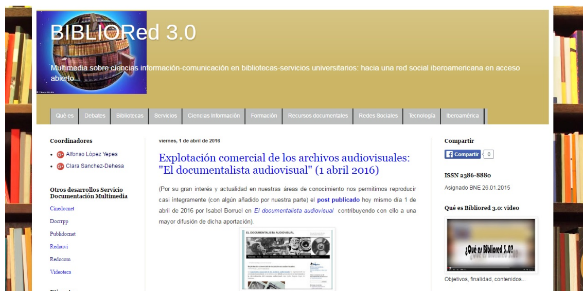
Figura 3: Bibliored3.0

En fin, se remite a algunos ejemplos de difusión del sitio a través de blogs, portales y redes sociales: Blogtecarios (Blogtecarios, 2015), Biblogsfera (Biblogsfera, 2014), El documentalista audiovisual (EDA, 2015) o Universo Abierto (Universo Abierto, 2015). O a través de los E-Prints Complutense (López Yepes, A. 2007), también accesibles vía REBIUN y su directorio de repositorios (REBIUN, 2015). Y en redes sociales tanto de ámbito general con el establecimiento de grupos en Facebook como Audiovisual 3.0 o como Somos 2.0 (Somos 2.0, 2015), Audiovisual 3.0 (Audiovisual 3.0) o Multimedibolivia (Multimedibolivia, 2015). Y otras redes sociales: Twitter (Twitter, 2015), Academia.edu (Academia, 2015), Researchgate.net (Researchgate, 2015), LinkedIn (LinkedIn, 2015) o Cero en conducta (Cero en conducta, 2015).