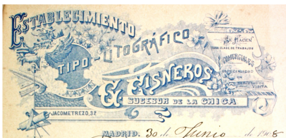
Figura 9. Membrete del Establecimiento Tipo-Litográfico C. Cisneros

Continuó con el suministro de material de escritorio el Establecimiento Tipo-Litográfico C. Cisneros, con sede en la calle Jacometrezo, nº 32, firmando las facturas de nuevo M. Gutiérrez, tal y como sucedió en la compañía de Ribed Miranda. Este nuevo establecimiento recibió tres encargos, el primero en junio de 1908, el segundo en diciembre de 1909 y el último en marzo de 1911, todos ellos para el suministro de objetos de escritorio entre ellos libros de actas además de cajas papel de cartas, carpetas, lapiceros, gomas de borrar, estuches de papel y sobres, plumas, botellas de tinta, sobres de oficio, papel secante "Figura 9".