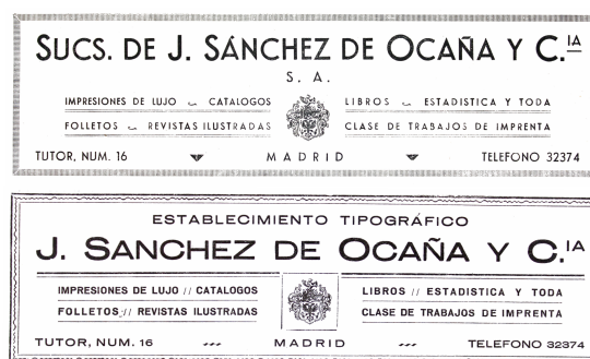
Figura 6. Membretes del establecimiento de los Sucesores de J. Sánchez de Ocaña de 1936 y 1941

Con fecha de junio de 1928, según la documentación encontrada en el Archivo de la Academia, el Establecimiento Tipográfico J. Sánchez de Ocaña y Compañía realizó la composición, tirada y encuadernación del Boletín , y del Anuario en enero 1935 y 1936 (7). Este establecimiento tuvo su sede en la calle Tutor nº 16, y realizaba impresiones de lujo, catálogos, folletos, revistas ilustradas, libros y toda clase de trabajos de imprenta. Otro trabajo que hemos localizado, con fecha del 15 de mayo de 1936, indica que se realizó la composición, impresión y encuadernación de 60 ejemplares de la Listas de asistentes de Señores Académicos .