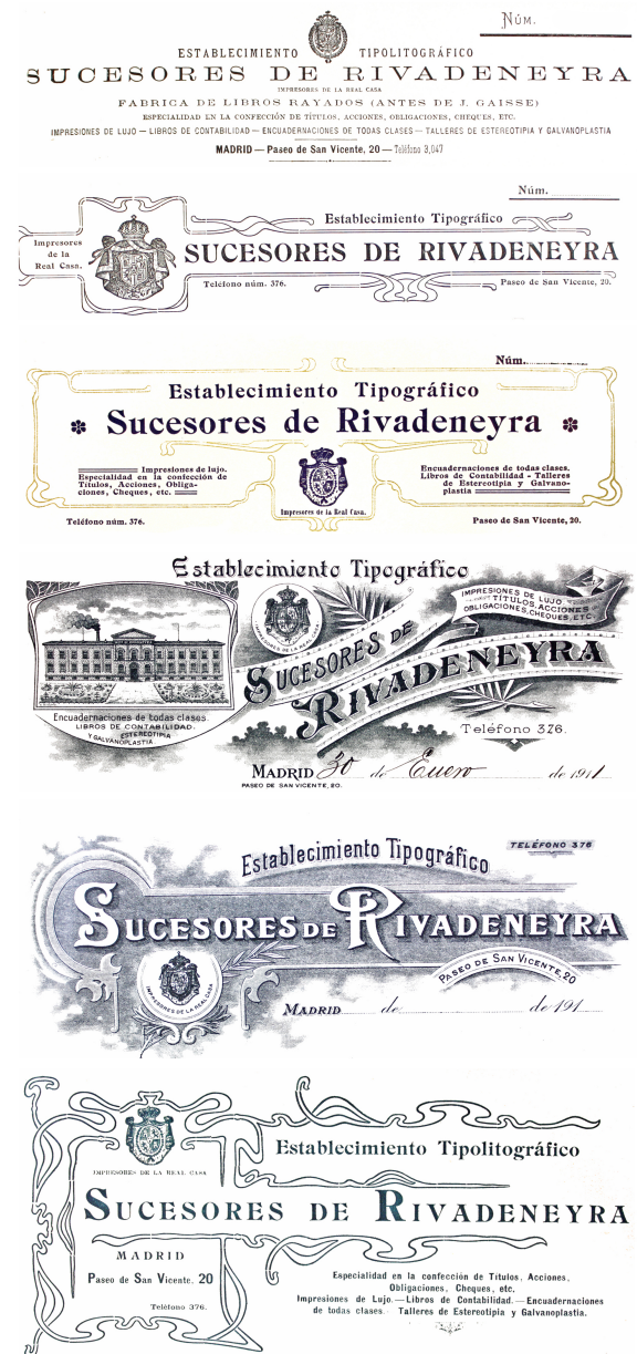
Figura 1. Membretes del establecimiento de los Sucesores de Rivadeneyra

Amós Salvador titulado La Enseñanza forzosa en castellano "Figura 1".