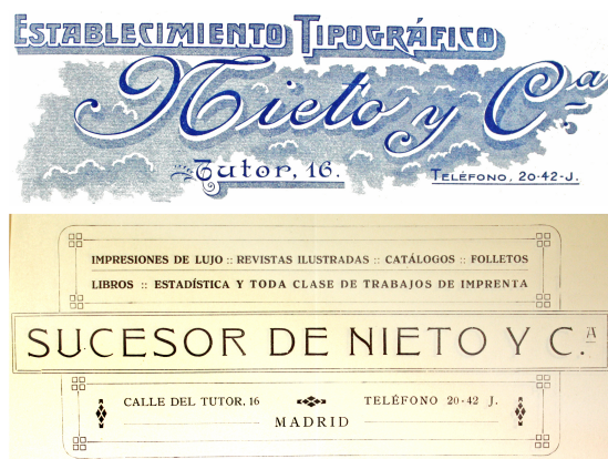
Figura 3. Membretes del establecimiento de Nieto y Sucesores de Nieto

A la muerte de Nieto, la compañía continuó con trabajos para la Academia como demuestran los libramientos realizados entre abril de 1925 hasta noviembre de 1926 (4) "Figura 3", donde se indica que se realizaron pagos por la composición, impresión y encuadernación del Anuario y Boletín de esos meses.