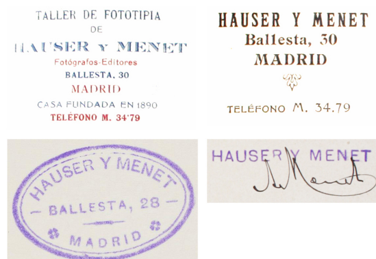
Figura 4. Membretes, sello y firma de Adolfo Menet