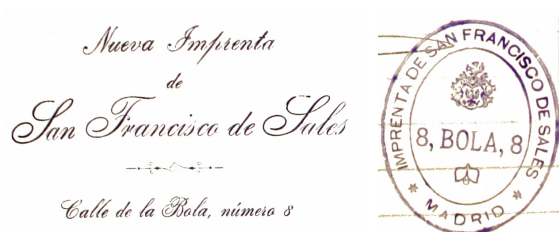
Figura 2. Membrete y sello de la Imprenta de San Francisco de Sales

Academia , siendo el segundo apunte del 12 de diciembre del mismo año para señalar el pago por la composición, tirada y encuadernación de 500 ejemplares del nº 3 del Boletín , no teniendo testimonio documental del libramiento del pago del nº 2, aunque si tenemos constancia de que los números sucesivos fueron impresos y encuadernados por esta imprenta, tal y como consta en el último apunte, del 16 de marzo de 1918, por la composición, tirada y encuadernación en rústica de 250 ejemplares, junto a otros trabajos como los 50 ejemplares de una memoria de Amós Salvador titulada Sobre un extraño modo de educación .