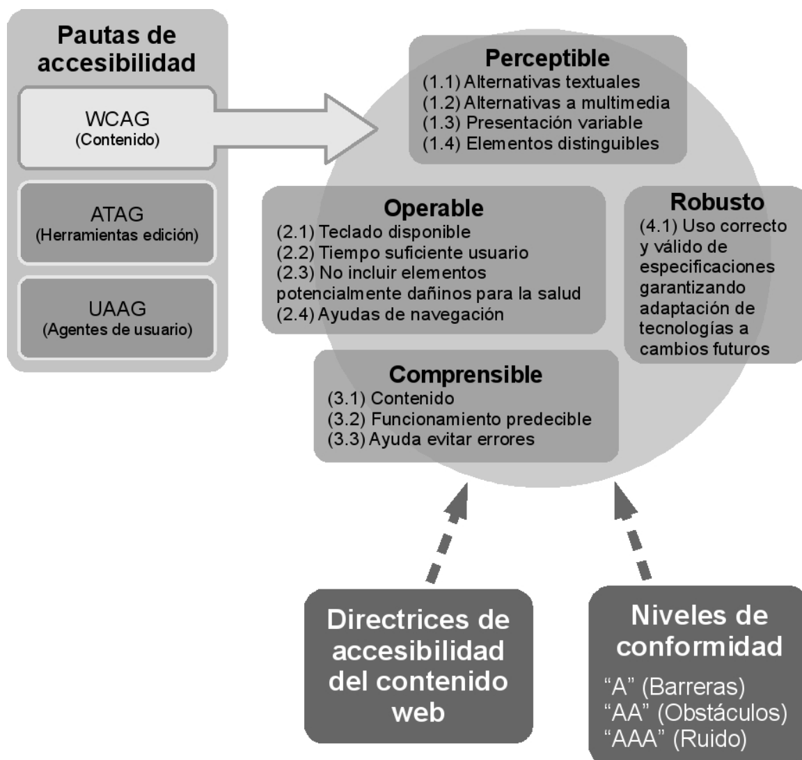
Figura 1: Visión global de la accesibilidad para el contenido web

Las pautas de Accesibilidad promovidas por el WAI se refieren al contenido Web (WCAG, Web Content Accessibility Guidelines ) a las herramientas de autor (ATAG, Authoring Tool Accessibility Guidelines ) y a los agentes de usuario (UAAG, User Agent Accessibility Guidelines ). Para los diseñadores y desarrolladores web las más importantes a tener en cuenta son las referidas al diseño del contenido. En la figura 1 se muestra una visión resumida y global de la estructura de las WCAG y su ubicación dentro de la iniciativa WAI.