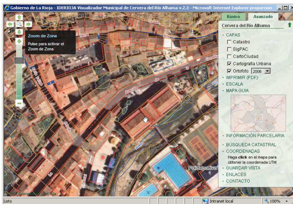
Figura 2. Visualizadores municipales